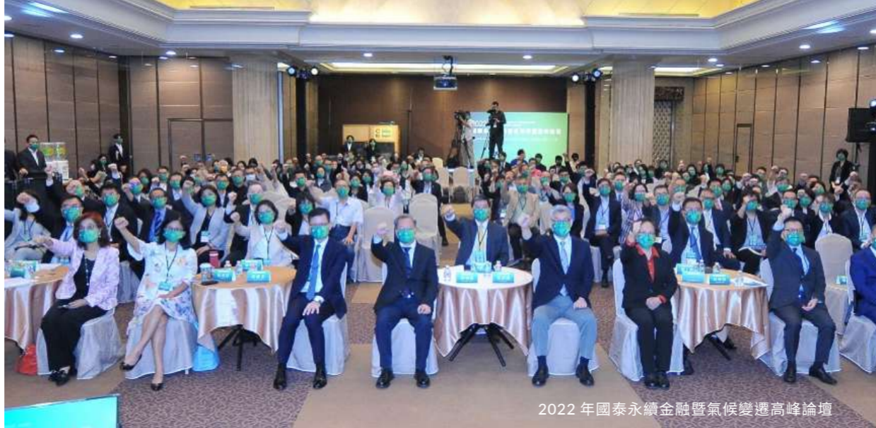
2022 年國泰永續金融暨氣候變遷高峰論壇